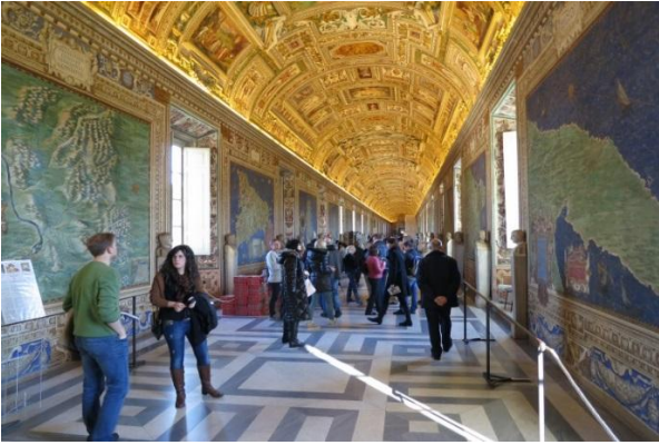
Vatikaanin museo: Sala dell Carte Geografiche