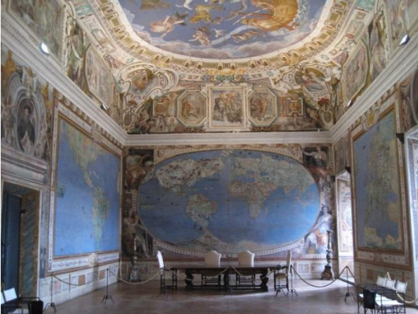
Caprarola, Sala del Mappamondo