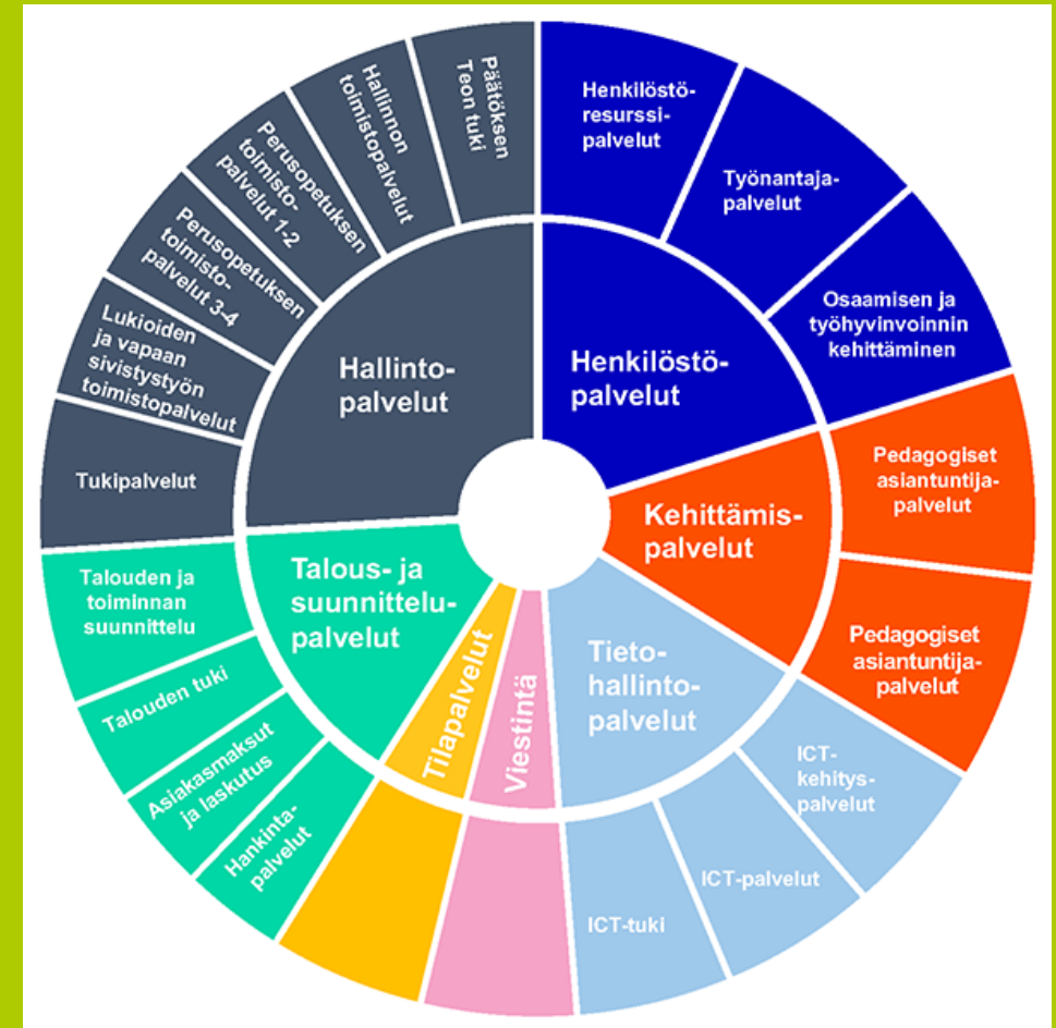
Helsingin kaupunki: Kasvatuksen ja koulutuksen toimiala