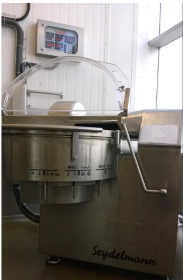
Maljakutteri (tehdaskunnostettu 2013), Seydelmann.