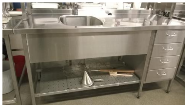
Pöytiä ruostumattomasta teräksestä tehtyjä, erilaisia. Kuvan mallit ovat viitteellisiä tai eivät edusta kaikkia myynnissä olevia