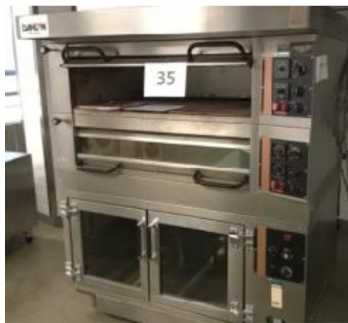
Arinakuuni nostatuskaapilla, Dahlen