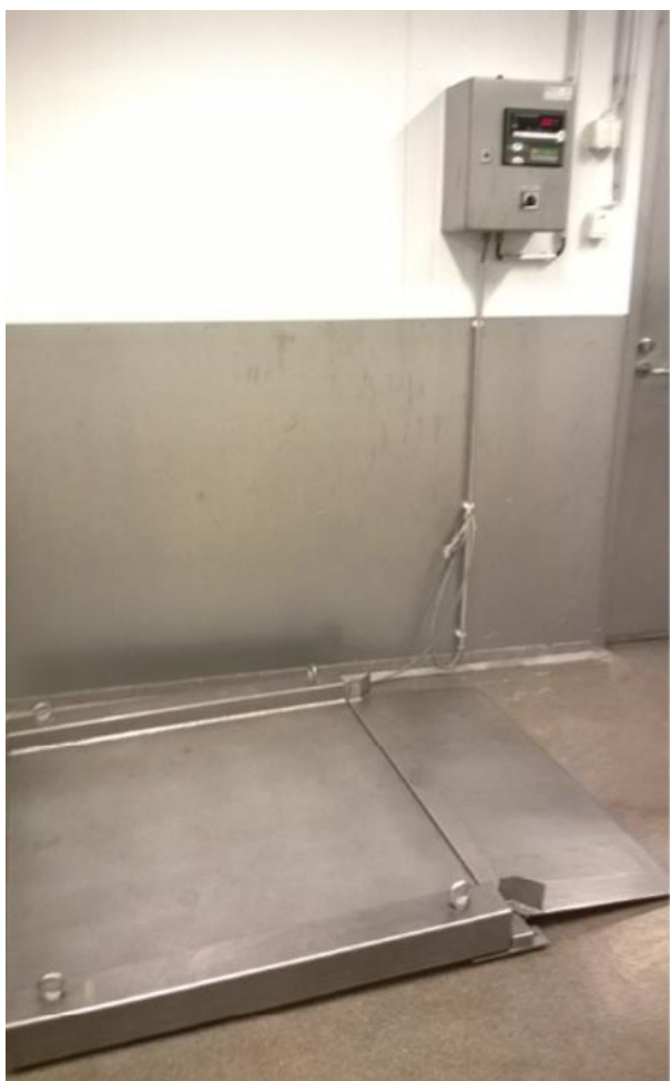
Lattiavaaka, max. 300 kg