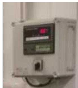
Ruhonostin, ruhonkuljetusrata ja punnituspiste