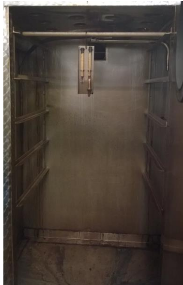
Kylmäsavukaappi Autotherm. tuotteille keppitasot.