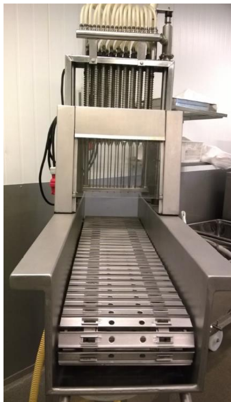
Suolauskone (vm 1990 noin), Injectstar.