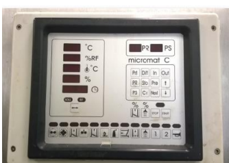
Lämminsavukaappi Vemag, 2:n vaunun kokoinen. Kauppaan kuuluu lisäksi: nestesavulaite, vesijäähdytyskaappi ja vaunut.