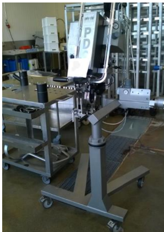
Puoliautomaattinen kaksoissulkijalaite (2013), Polyclipp PDC 700.