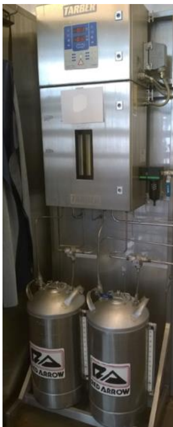
Nestesavulaitteisto Tarber kuuluu Vemag-kaapin kauppaan.