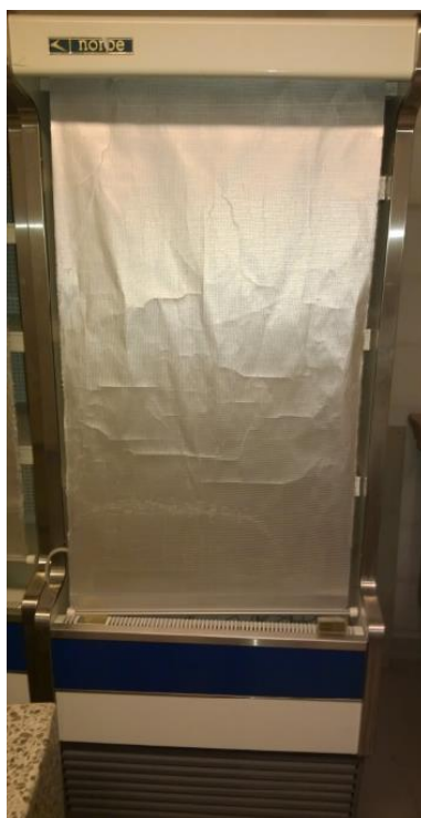
Myyäläkylmävitriini, Norpe 2 kpl, joista toisessa kuultavissa sivuääni kylmäkompressorin käydessä.