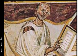
Augustinus (354 - 430 jKr.) (Rooma, 500-luku)