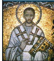
Johannes Khrysostomos (347 - 407 jKr.) Istanbul, 900-luku.