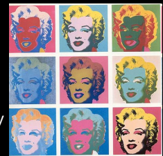
Marilyn (1967). Andy Warhol (1928-1987).