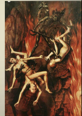
Hans Memling (1435-1494): Viimeinen tuomio (osa)