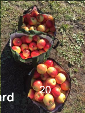
Minun Omenapuu -omenasadon korjuuta