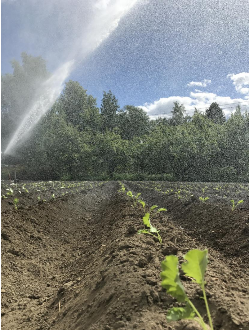
Elämyksiä kumppanuus- maatilalla