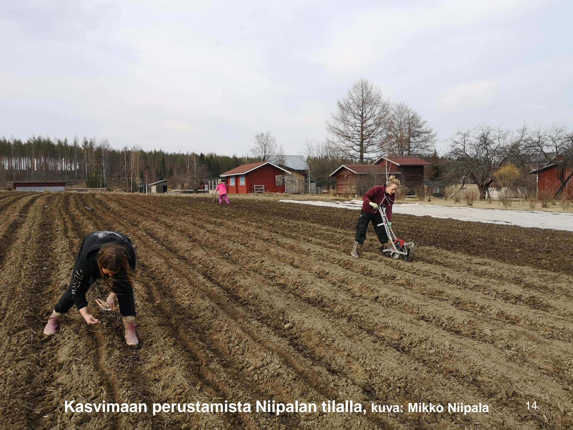
Kasvimaan perustamista Niipalan tilalla, kuva: Mikko Niipala