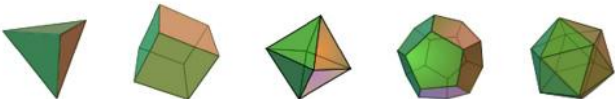
Platonin kappaleet: tetraedri, heksaedri, oktaedri, dodekaedri ja ikosaedri.

Tässä työssä inversio-ongelmia lähestytään Platonin kappaleiden avulla. Platonin kappaleet ovat säännöllisiä monitahokkaita. Niitä on yhteensä viisi erilaista: tetraedri eli nelitahokas, heksaedri eli kuutio, oktaedri eli 8-tahokas, dodekaedri eli 12-tahokas ja ikosaedri eli 20-tahokas. Platon itse uskoi maailmankaikkeuden muodostuvan näiden viiden kappaleen muodostamista osista.