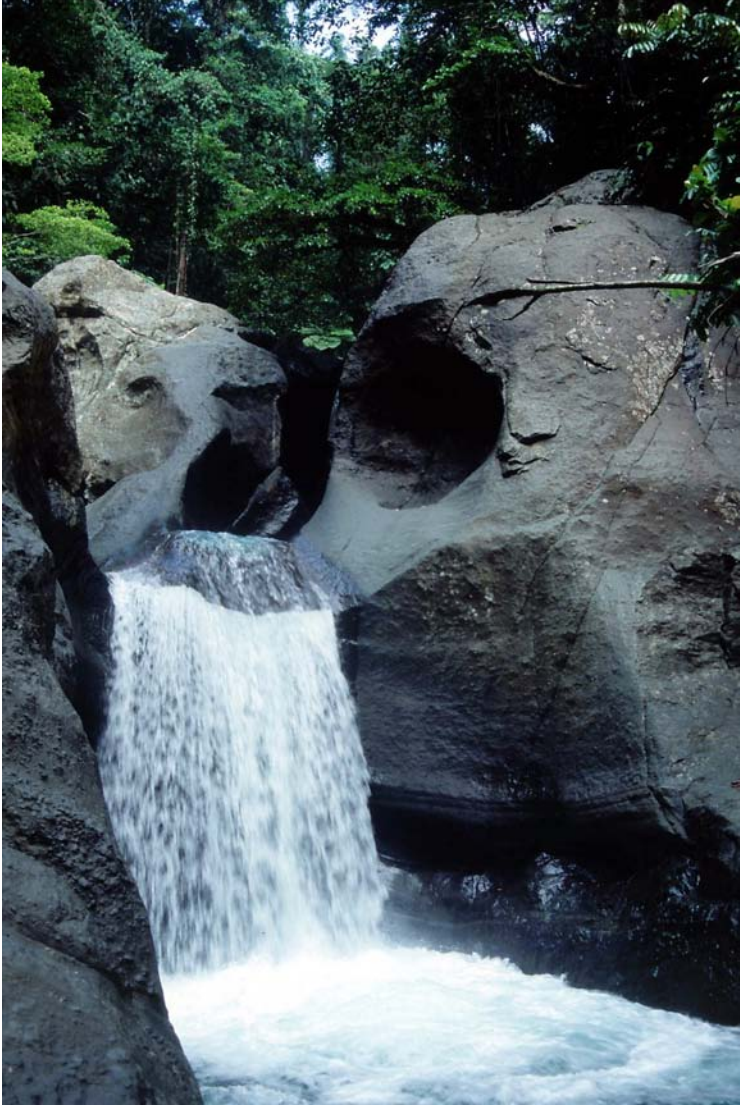
Kuva 3. Paikallistettu historia: Telpuputkeis, eli mies, joka yritti kaivaa pussikiipijää kivistä. Vesiputouksen nimi viittaa myyttiseen tarinaan, joka kuvaa paikan maastonmuotojen syntyä (Tuomas Tammisto).