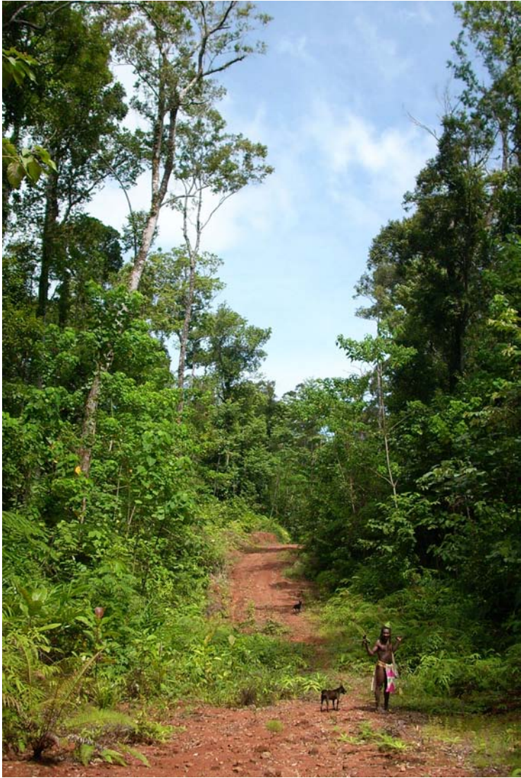
Kuva 1. Primäärimetsään hakkuiden yhteydessä raivattu metsäautotie. Metsästäjänä oleva mies on poikkeuksellisesti pukeutunut perinnelannevaatteen (Tuomas Tammisto).