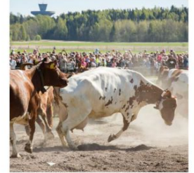
Lehmät nauttivat kesälaitumista Viikin tutkimustilalla 2016.

sella pyöritetään myös pop up -tiedekulmaa ravintola Tähdän tiloissa. Tiedekulmassa Helsingin yliopiston tutkijat kertovat tutkimuksistaan. Aiheena on esimerkiksi sikojen kasvatus ilman antibiootteja. Ravintolassa voi myös syödä. Lapsille paikalla on puuhanavetta ja leikkitraktori, jossa voi suorittaa traktorikortin.