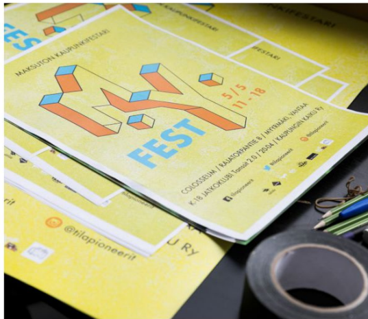
Opiskelijat ovat jakaneet pitkin Myyrmäkeä kaupunkitapahtuman mainoksia.