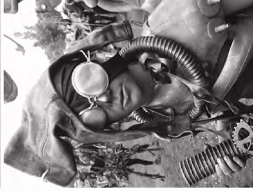
Kuva: Fusion Festival 2013, Montecruz Foto, (CC BY-SA 2.0) www.helsinki.fi/yogaisto