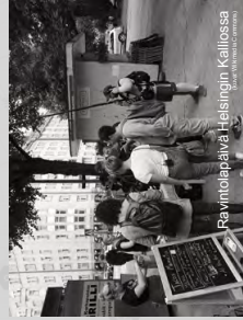
Ravintolapäivä Helsingin Kaupissa

Yhteisöaktivismi, jakamis/alusta/vertais/ kansalaistalouspalvelut, tila-aktivismi, digiaktivismi, aktivismin tuki