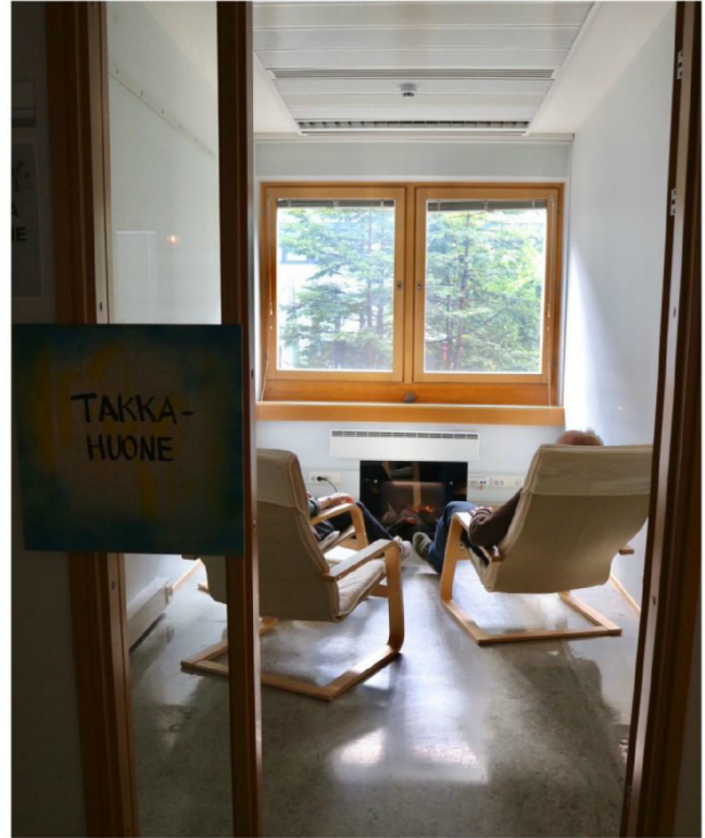
Lopuksi vinkki toimistoille: takkahuone vähentää (loppuun)palamisen riskiä.

“Tilapäisellä toiminnalla on taipumusta muodostua pysyväksi.”