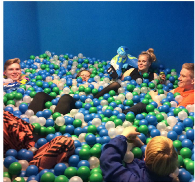
Mitä olisikaan olohuone ilman pallomerta?