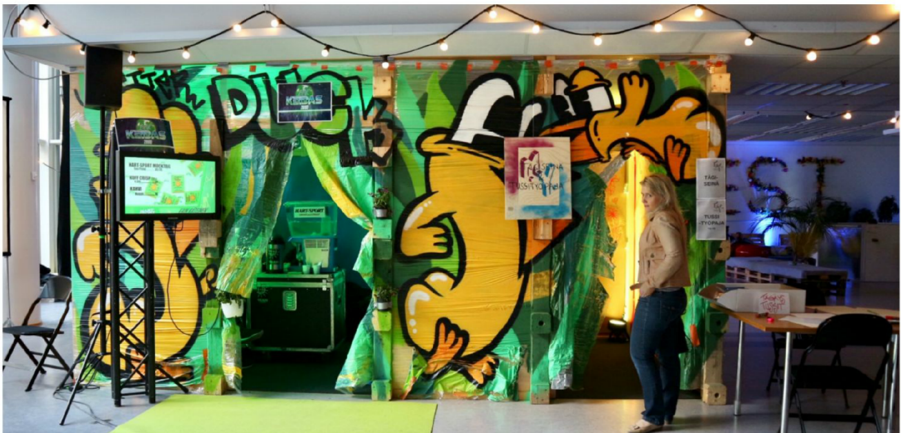
Myfestissä saattoi törmätä katon alle kaapattuun katutaiteeseen sekä avoimiin työpajoin.