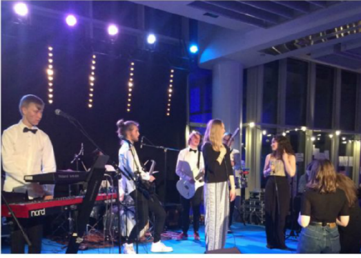
Tanssiaiset kruunasivat värikkään festivaalipäivän.