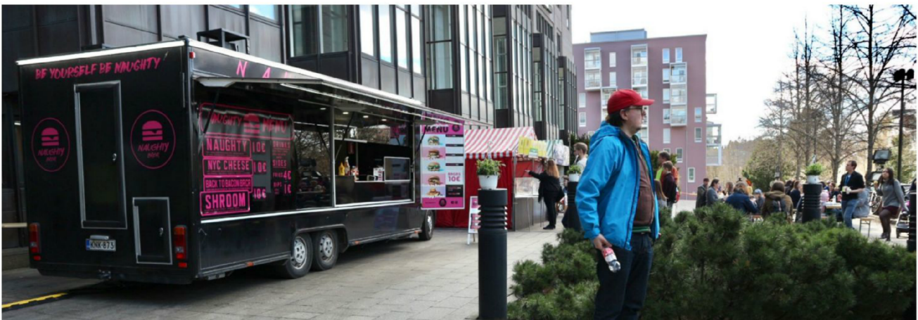
Kulttuuriravitsemuksen lisäksi myös perinteisempää ravitsemusta.

lajimieltymysten mukaan muuntuvaa tilaa tanssin rakastajille.