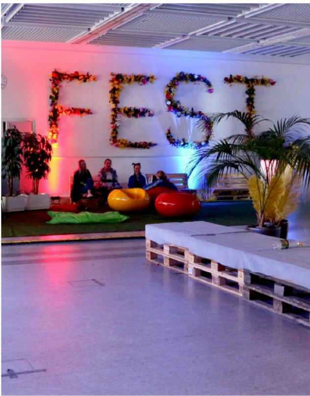
Antaa kaikkien seinäkukkien kukkia.