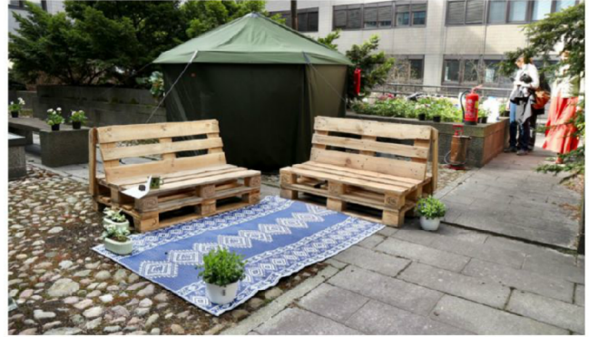
Sisäpiha muuttui telttasauna-aukeaksi.

TOUKOKUUN ALUN M.Y. FESTISSÄ oli mahdollisuus kokea, millainen Colosseum olisi länsivantaalaisten monitoimisena olohuoneena. Tilapioneerit toteutti siellä yhteistyössä paikallisten vapaaehtoistoimijoiden, yritysten ja Vantaan kaupungin kanssa kehittelemiään ideoita tilojen tilapäiskäytöksi. Colosseumissa oli muun muassa Myrstin makuja -ruokamaailma, monenmoisia kaupunkitaiteen elämyksiä, matalan kynnyksen esiintymistiloja, pakohuonepelejä ja eri-ikäisten ja eri