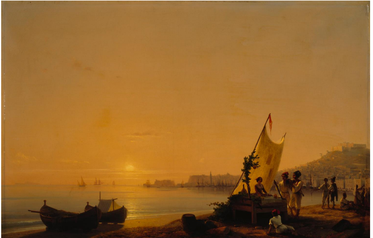
Ivan Aivazovski (1817–1900): The Bay of Naples / Napolinlahti / Neapelbukten