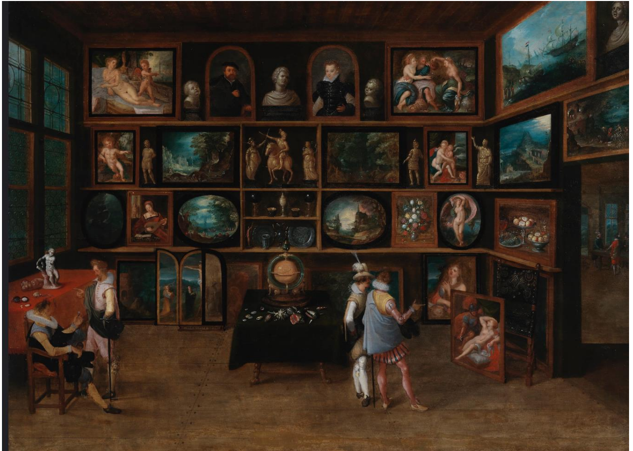
Hieronimus Francken II (1578–1623): Connoisseurs at a Gallery / Taiteenystäviä galleriassa / Konstkännare i ett galleri