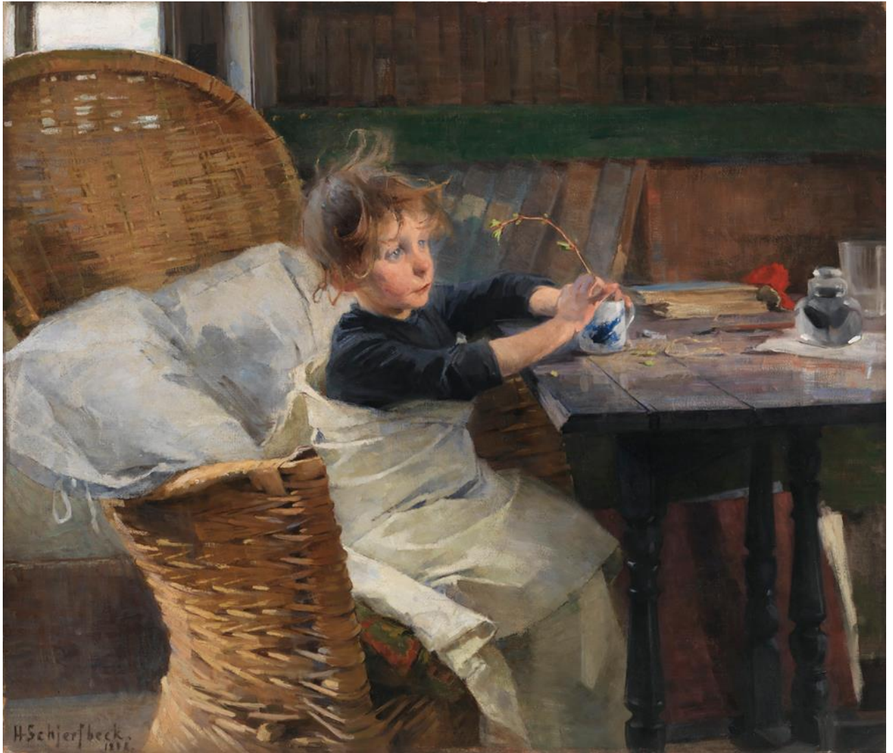
Helene Schjerfbeck (1862-1946): The Convalescent / Toipilas / Konvalescenten