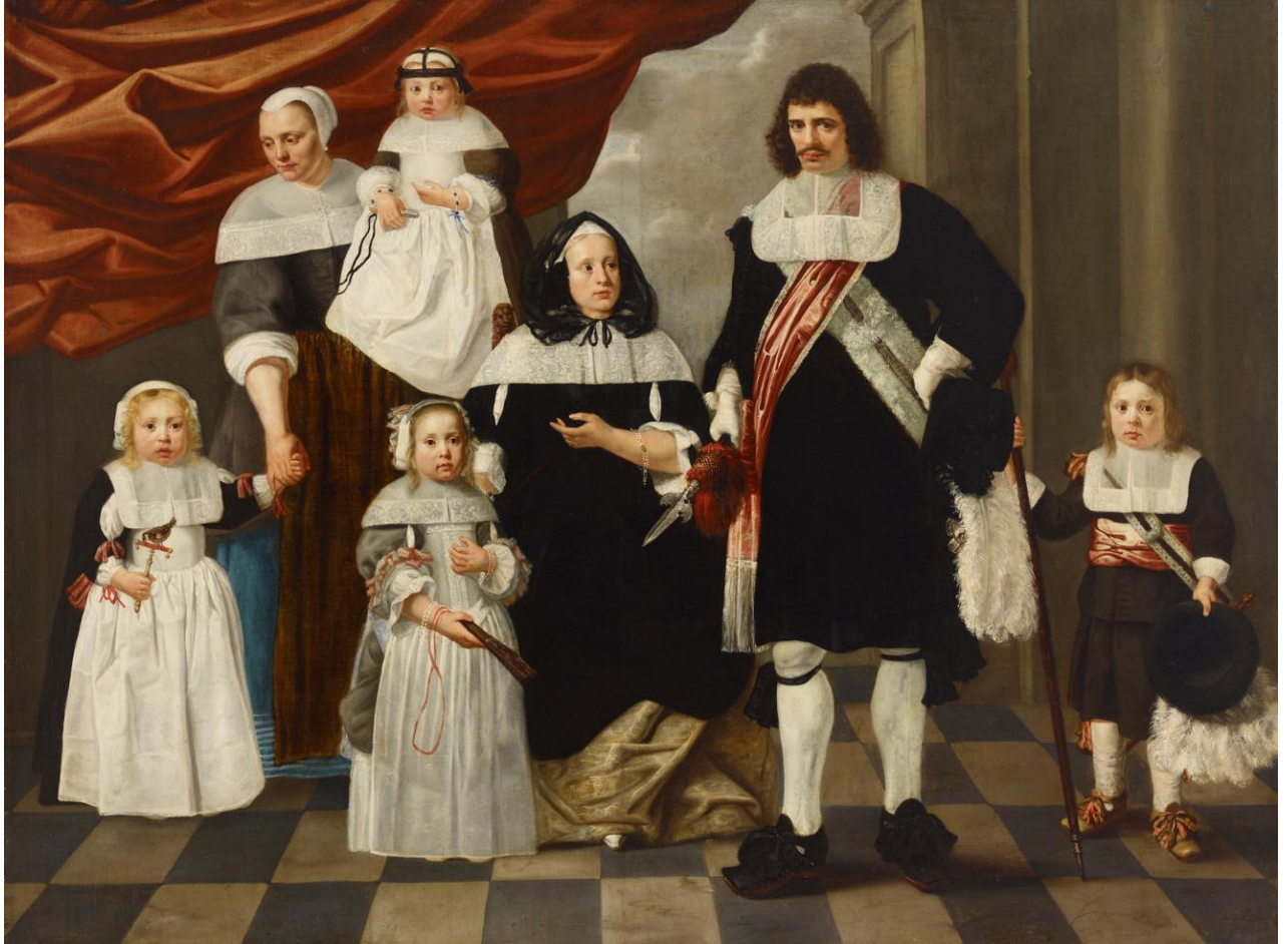
Nicolaes van Helt-Stockade (c. / n. / ca. 1614–1669): Portrait of a Family / Perhemuotokuva / Familjeporträtt