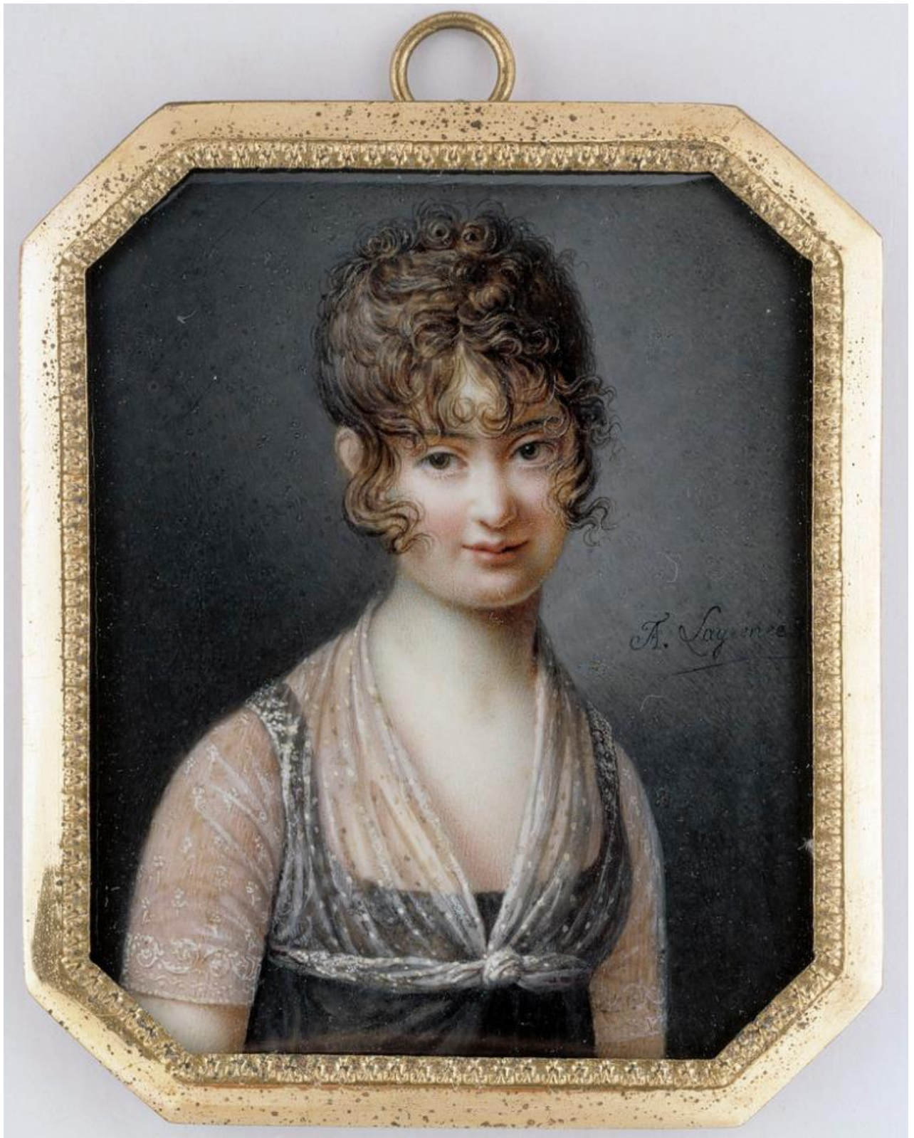
François Lagrenée (1774–1832): Portrait of a Lady / Naisen muotokuva / Porträtt av en kvinna