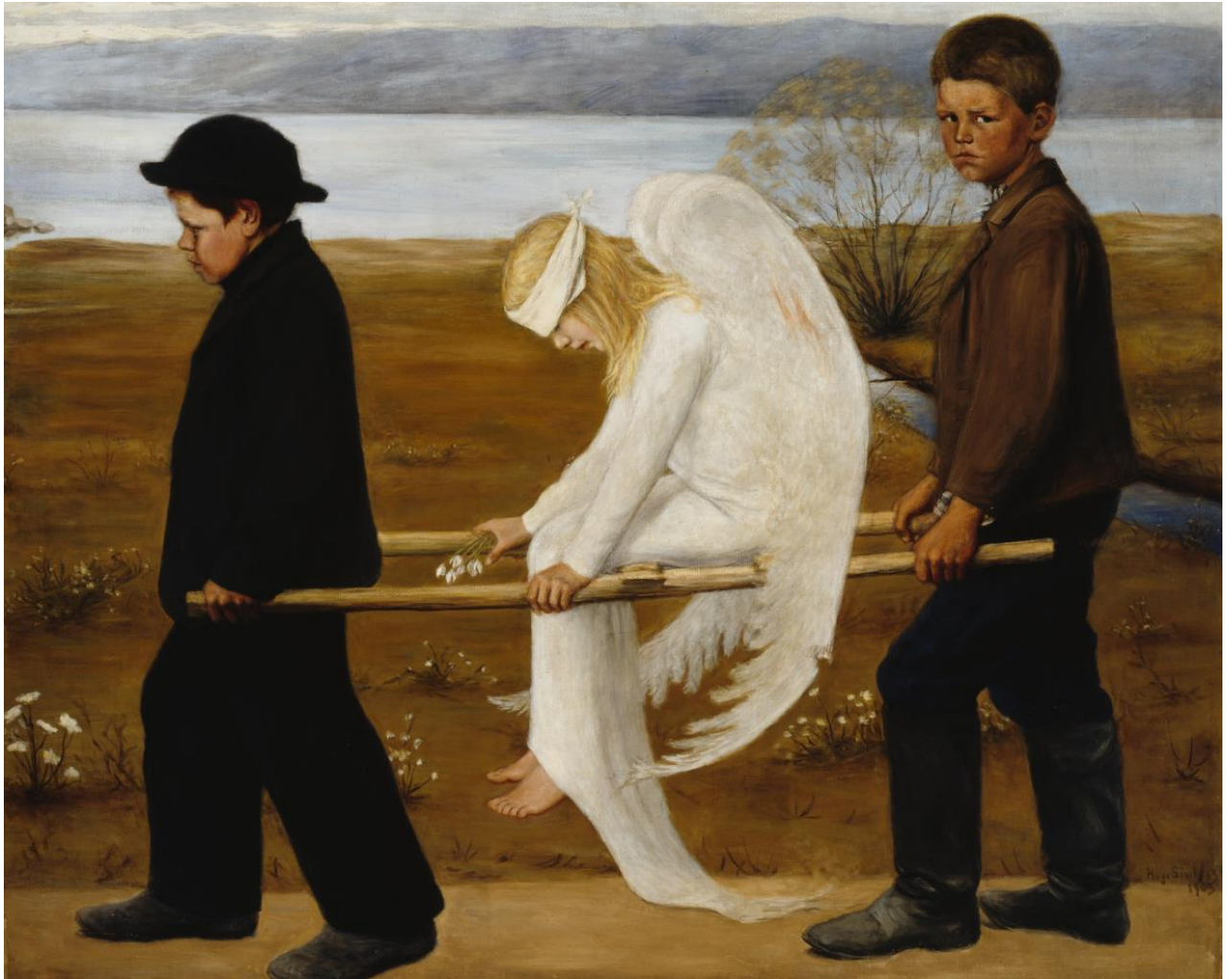
Hugo Simberg (1873–1917): The Wounded Angel / Haavoittunut enkeli