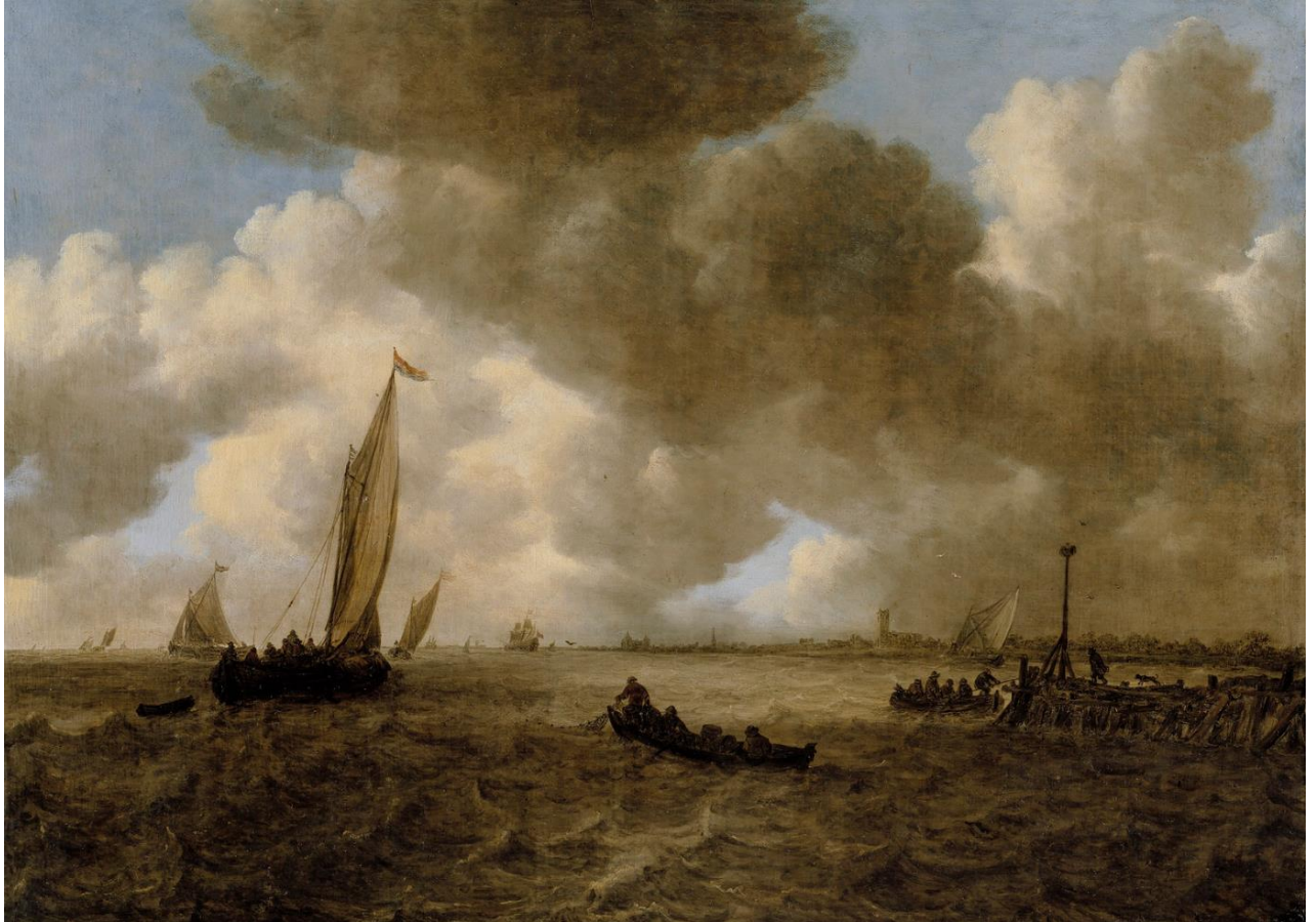
Jan van Goyen (1596–1656): A Stormy Seascape / Myrskyinen merimaisema / Stormigt hav