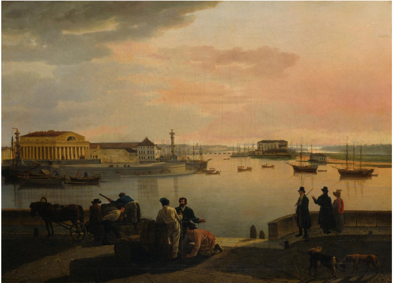
Silvestr Feodosievitš Štšedrin (1791–1830): A View from St. Petersburg / Näkymä Pietarista / Vy från Petersburg