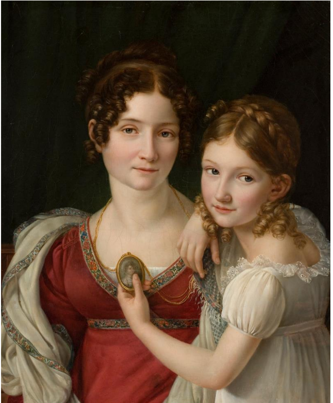
Henri-François Riesener (1767–1828): Portrait of a Mother with her Daughter / Muotokuva äidistä tyttärensä kanssa / Porträtt av en mor med sin dotter