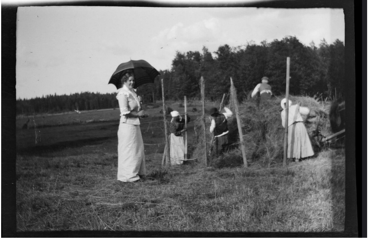
HS Familjeliv 1914 232, 1914