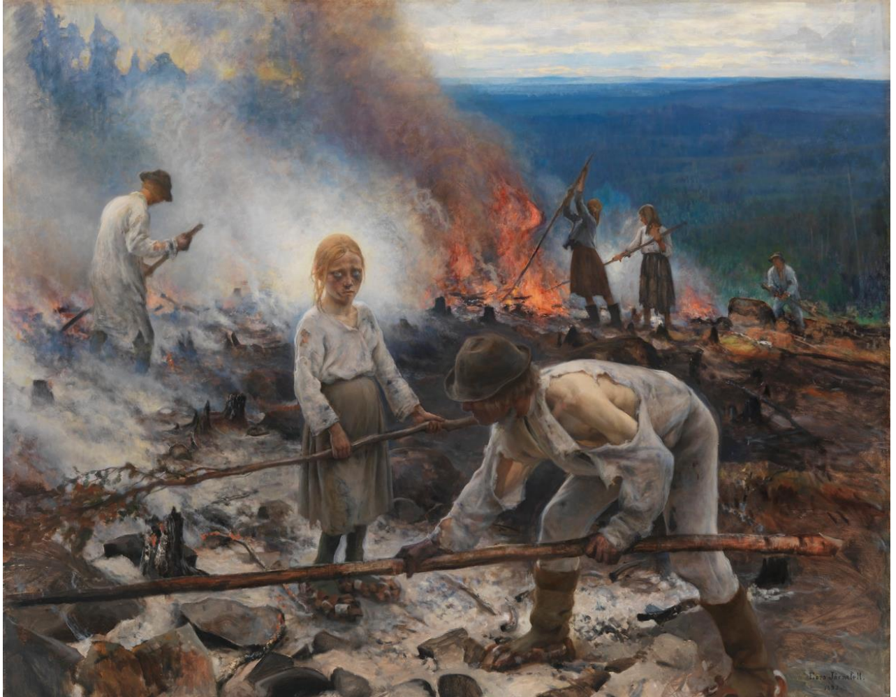
Eero Järnefelt (1863-1937): Under the Yoke (Burning the Brushwood) / Raatajat rahana- laiset