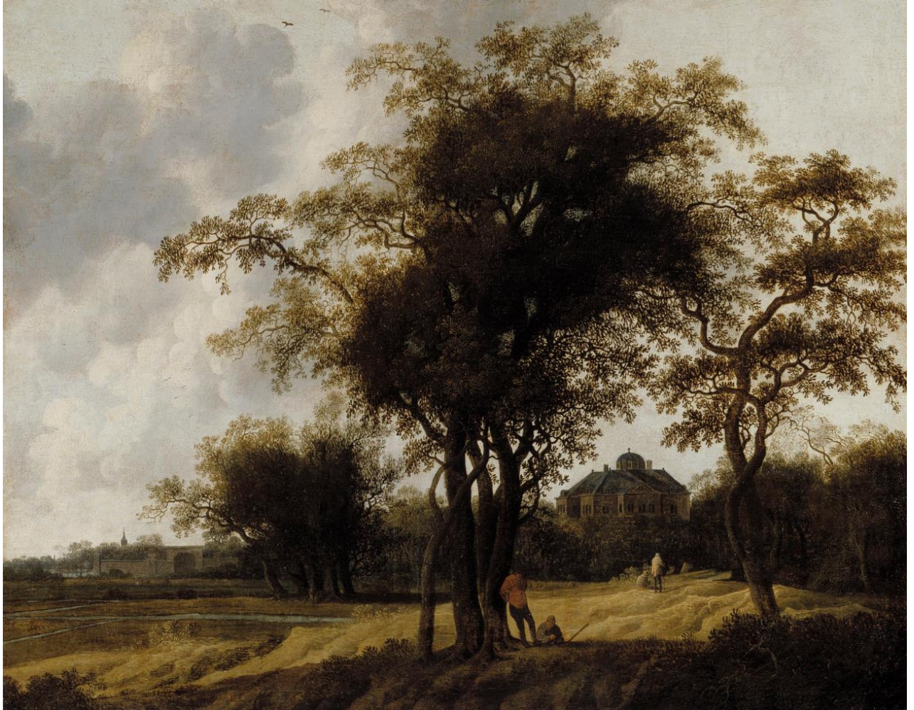
Anthony Jansz. van der Croos (1606/07–1665 after / jälkeen / efter): The Park of the Palace of Huis ten Bosch / Huis ten Bosch -linnan puisto / Parken vid slottet Huis ten Bosch