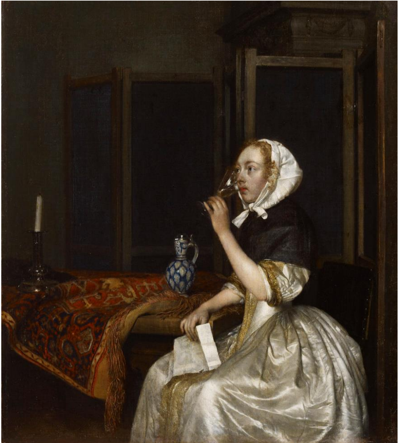
Gerard ter Borch (1617–1681): Lady seated holding a Wineglass / Viiniä juova nainen kirje kädessään / Vindrickande kvinna