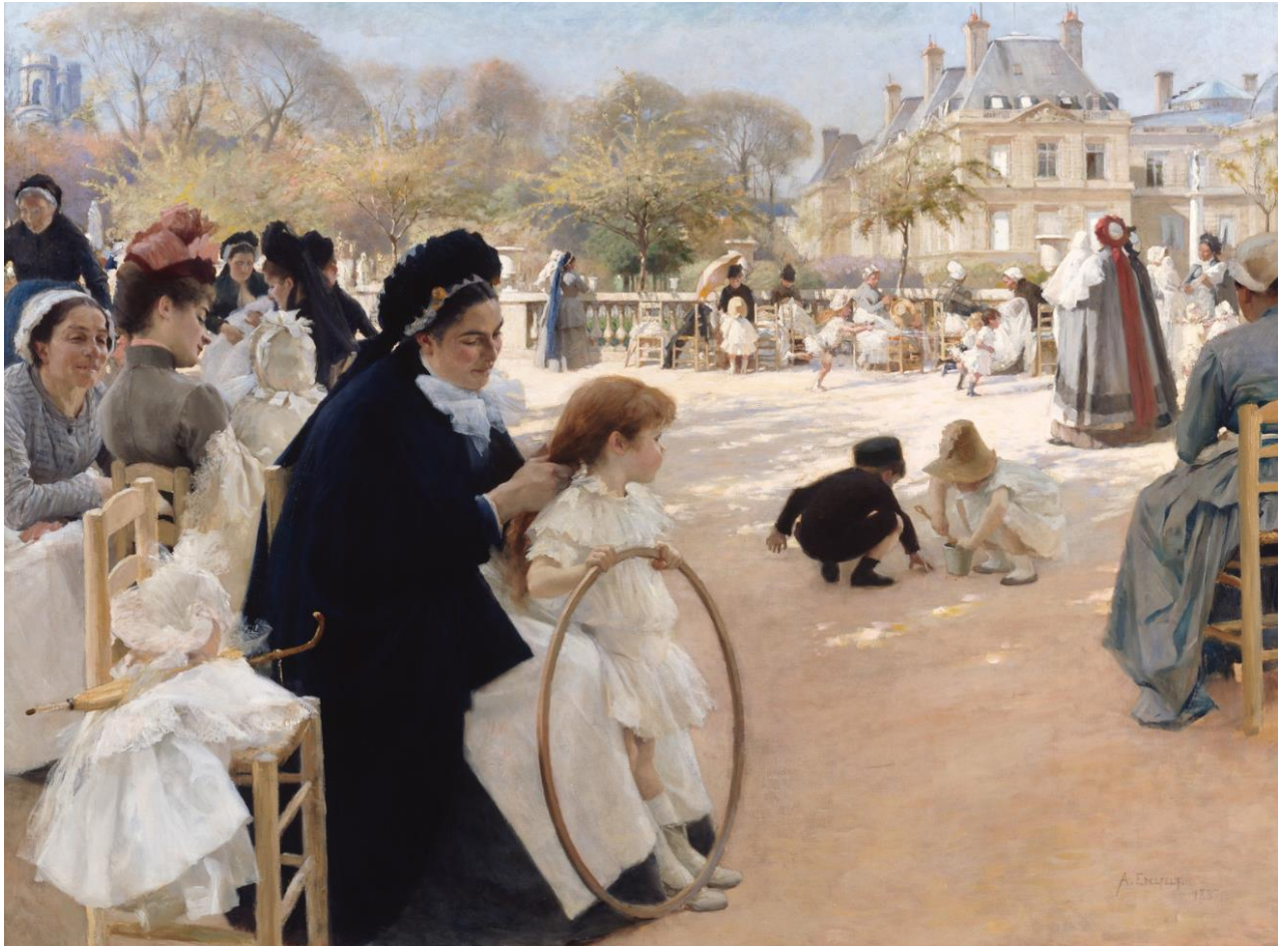
Albert Edelfelt (1854–1905): The Luxembourg Gardens, Paris / Pariisin Luxembourgin puistossa