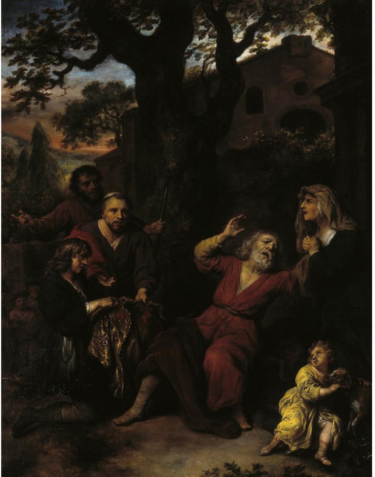
Govaert Flinck (1615–1660): Joseph's Blooded Cloak / Joosefin verinen viitta / Josefs blod- iga mantel