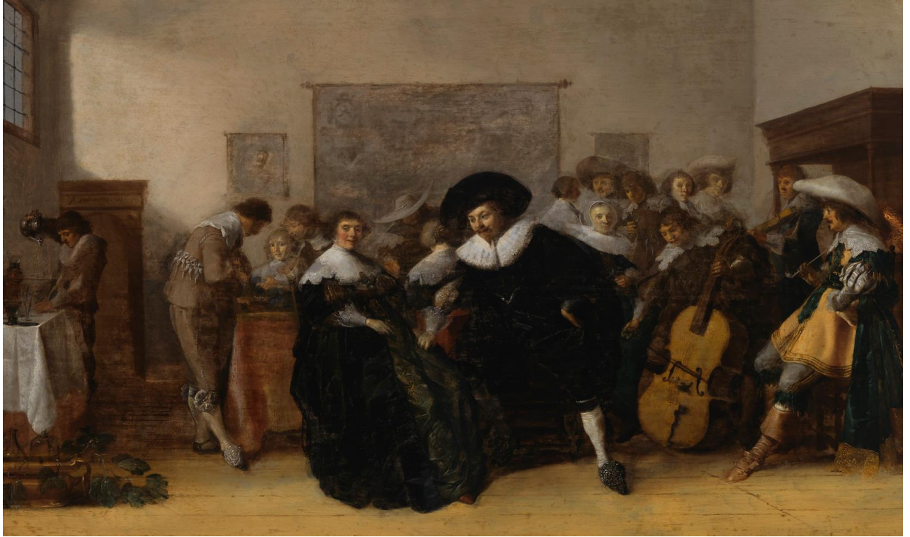
Antonie Palamedesz. (1601–1673): A Musical Company / Soittoa ja seurustelua / Musik och sällskapande