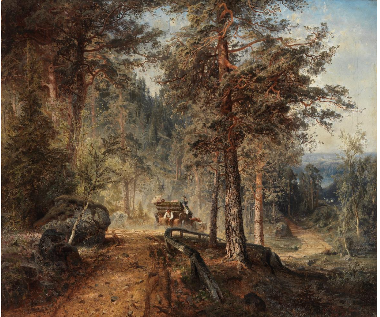
Werner Holmberg (1830–1860): Road in Häme (A Hot Summer Day) / Maantie Hämeessä (Helteinen kesäpäivä)