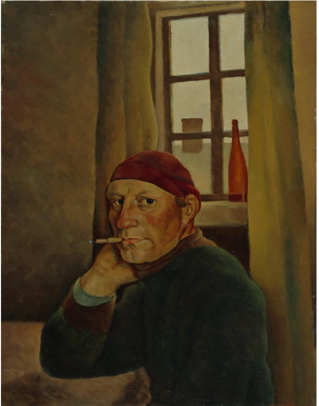
Vilho Lampi (1898–1936): Self-Portrait / Omakeuva