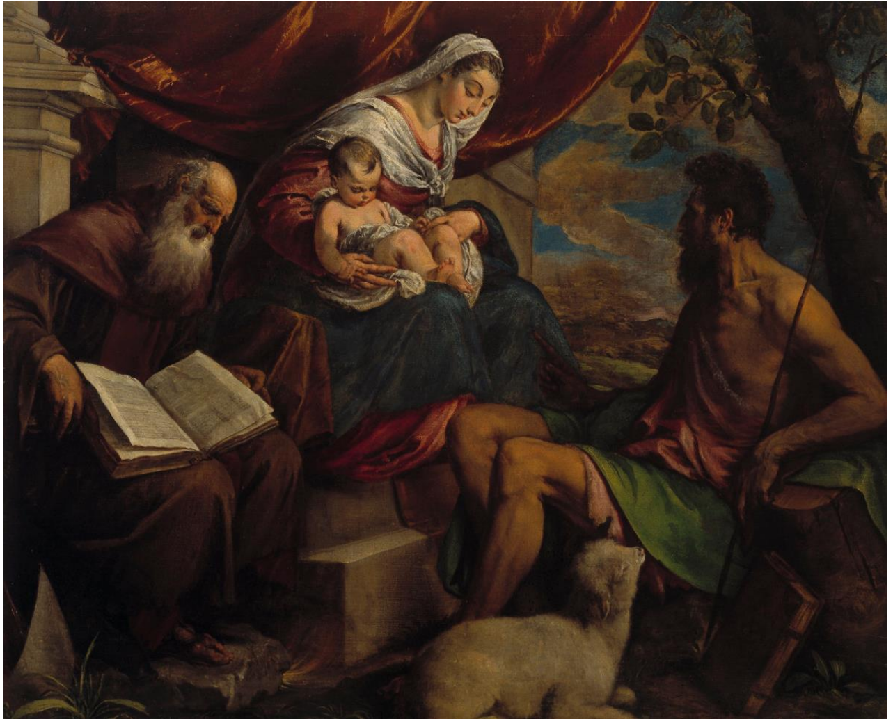
Jacopo Bassano (c. / n. / ca. 1510–1592): Virgin and Child with John the Baptist and Saint Anthony the Abbot / Neitsyt Maria, Jeesus-lapsi, Johannes Kastaja ja Pyhä Antonius Apotti / Jungfru Maria, Jesusbarnet, Johannes Döparen, S. Antony Abbot