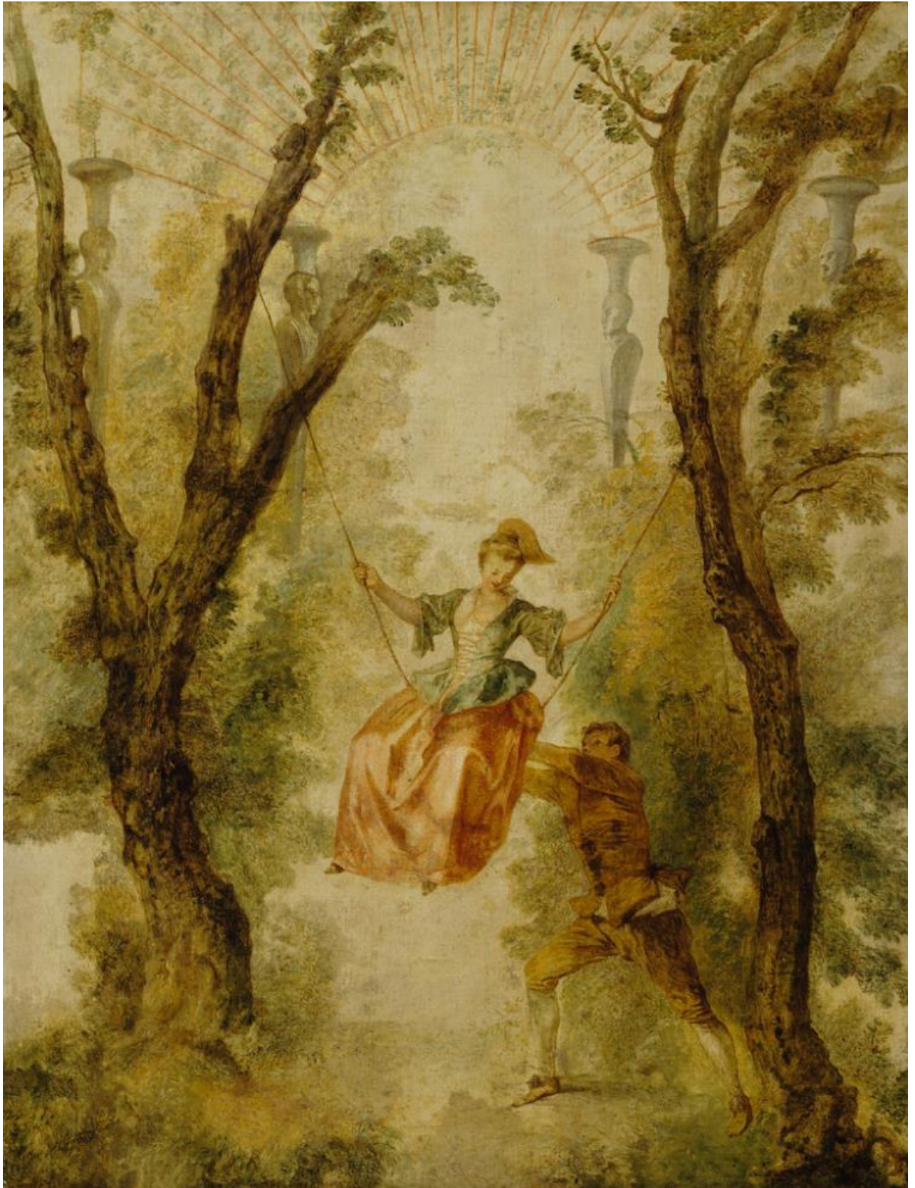
Antoine Watteau (1684–1721): The Swing / Keinuu / Gunga