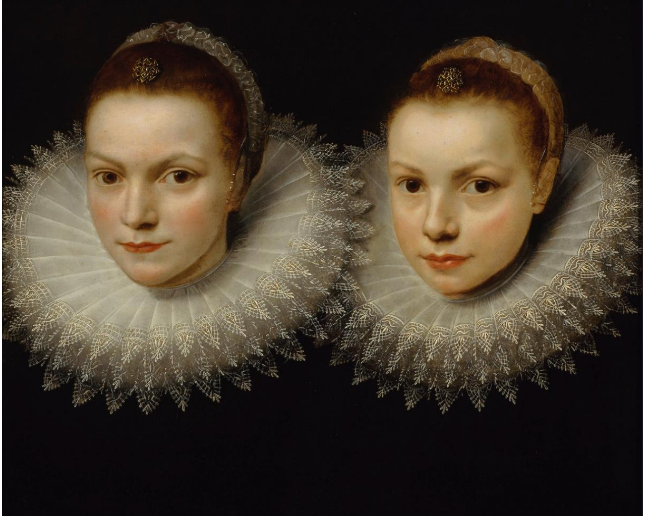
unknown / tuntematon / okänd (Cornelis de Vos?): Two sisters / Kaksi sisarta / Två systrar