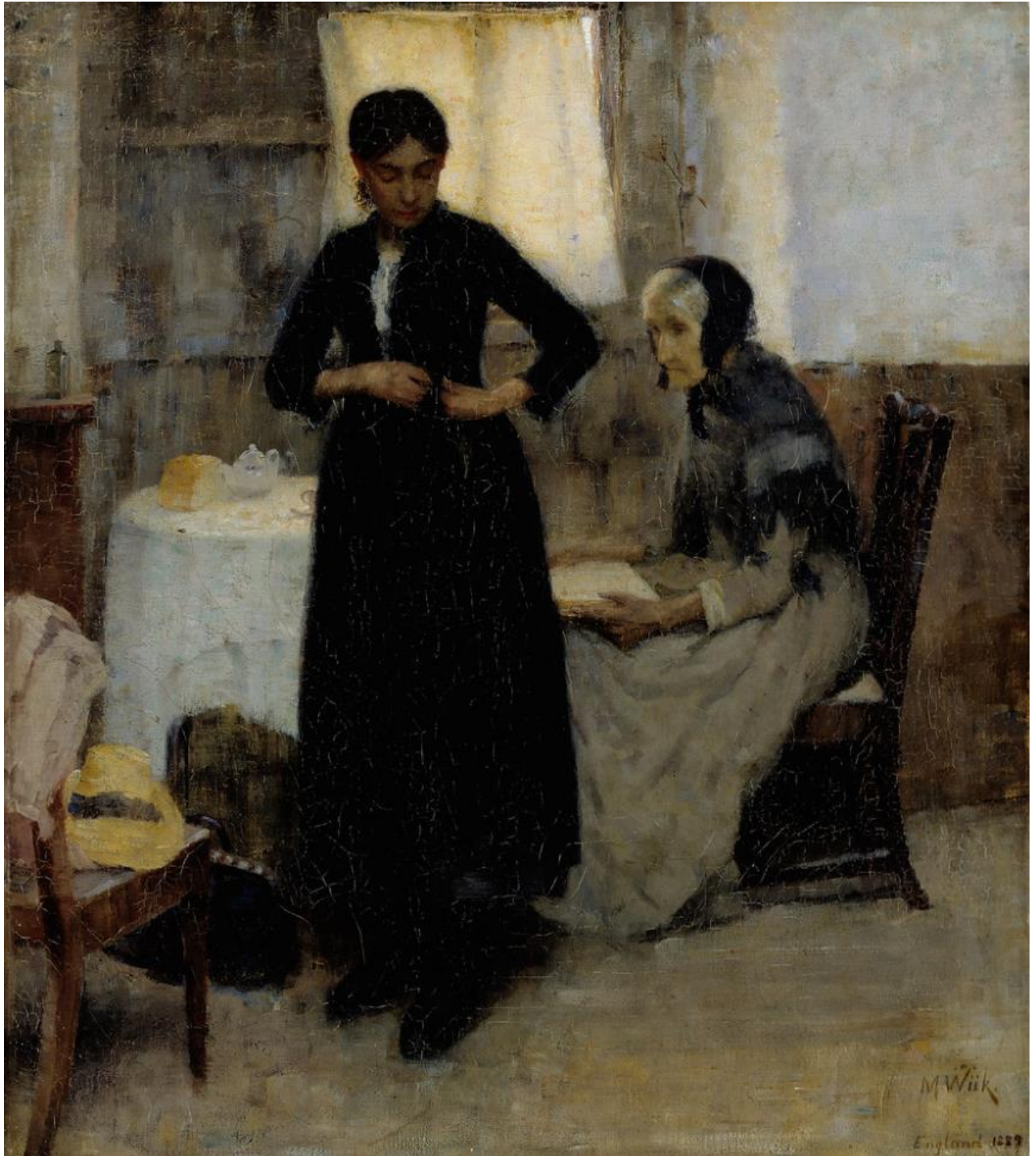
Maria Wiik (1853–1928): Out into the World / Maailmalle