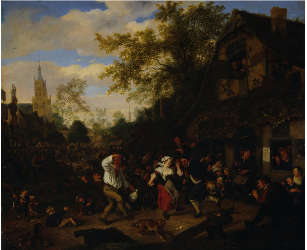
Cornelis Dusart (1660–1704): A Kermess / Markkinakuva / Marknadsscen