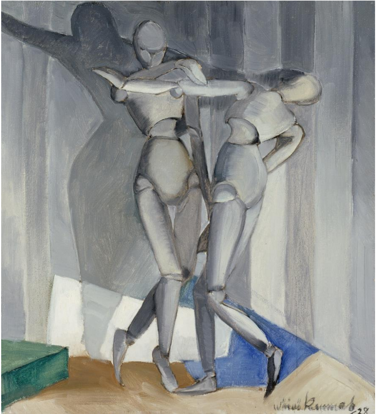
Väinö Kunnas (1896–1929): The Grey Dance / Harmaa tanssi