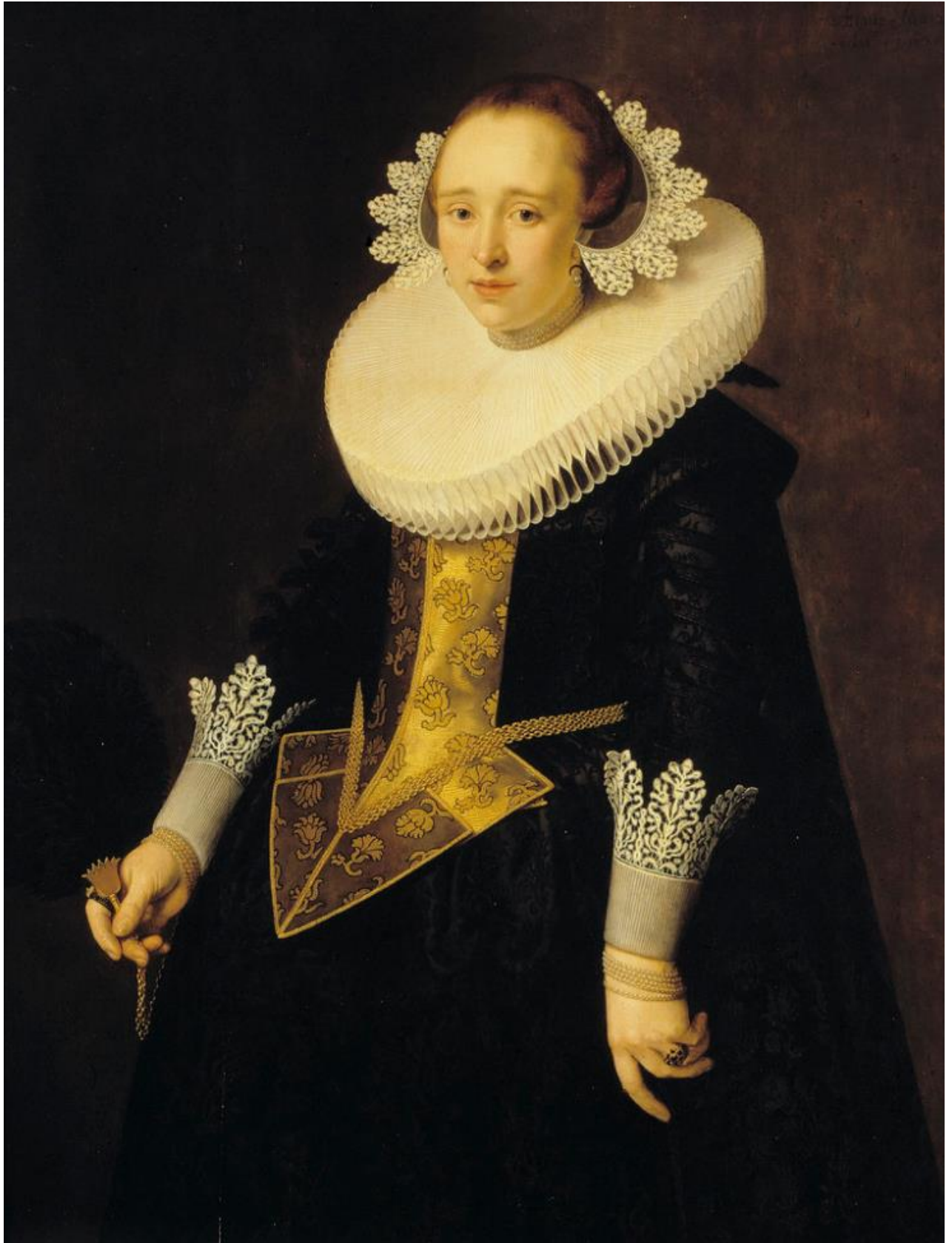
Nicolaes Eliasz. Pickenoy (1588–1650/56): Portrait of a 22-year-old woman / 22-vuotiaan naisen muotokuva / Porträtt av 22-årig dam