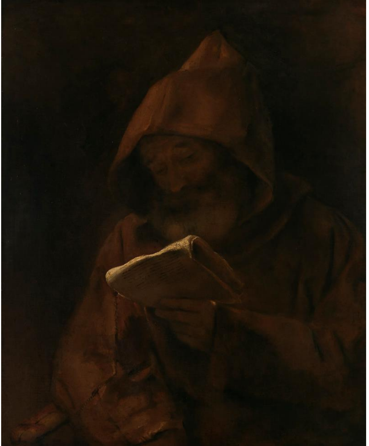
Rembrandt Harmensz. van Rijn (1606–1669): Monk Reading / Lukeva munkki / Läsande munk